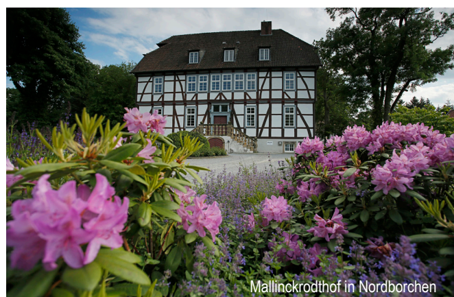
Möllinkrodthof in Nordborchen

Abgefahren werden nur Sperrgutmengen bis zu 2,5 m³ aus Haushalten, wie z.B. Möbel, Matratzen, Lattenroste. Nicht abgefahren werden z.B.: - Baum- und Strauchschnitt - Kartonagen - Plastiksäcke - Bauschutt - fest eingebaute Haushaltsgegenstände - Gewerbeabfälle - Elektroaltgeräte (s. Kühl- und Elektrogeräte) Sperrgut wird abgeholt, nachdem die Gebühr durch Bareinzahlung im Rathaus oder per Banküberweisung entrichtet wurde. Die Sperrgut-Anmeldekarten liegen in Banken, Sparkassen sowie im Rathaus aus. Die Anmeldung kann ebenfalls digital über die Homepage der Gemeinde Borchen erfolgen.